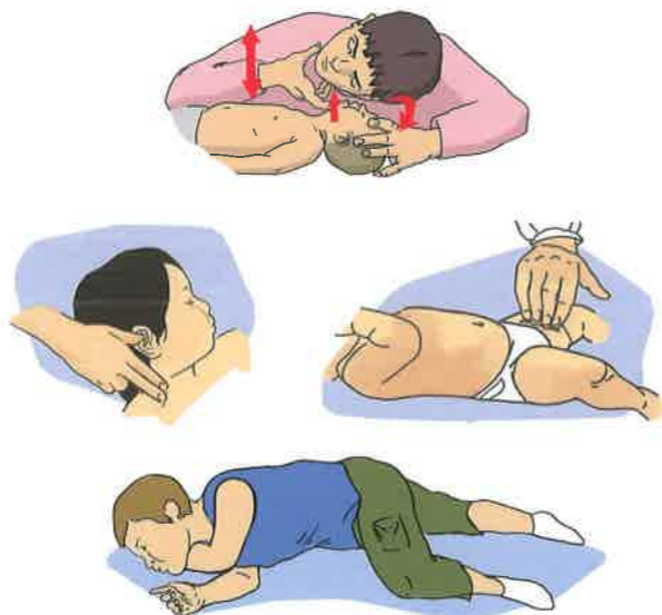
Устойчивое боковое положение